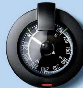
Kreiselkompass Erfinder: Dr. Hermann Anschütz-Kaempfe Deutschland, 1907

Richtungsweisend. Made in Germany. So finden Sie uns in Dortmund.